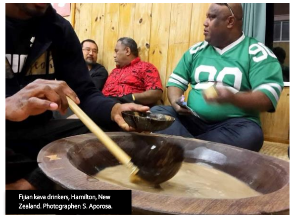
Fijian kava drinkers, Hamilton, New Zealand.

Na nona vakadidike butakatakata saraga oqo o Aporosa e vakadeitaka ga na nona vakadidike taumada ni duatani na veika e vakayacora na yaqona, me vakatautauvatataki kei na alokaolo, ka wili talega kina na wainimate gaga. E vakamacalataka ko koya: “E dina ga ni levu na kena revurevu ena noda tuvana vakamatau na vakatulewa, ia e sega ni vakataka ga na veika e dau vakayacora na alakaolo kei na wainimate gaga ena tuvaki ni vakasama ni dua na tamata. E vakaraitaka talega na vakadidike taumada oqo e sega ni rawa ni da tukuna ni veivakamatenitaki na yaqona me vaka na alakaolo, se vakavuna na tirivu cala me vaka na wainimate gaga, ka sega talega ni rawa ni vakalialiana e dua na tamata.” E tomana: “Na kena vakatokai tiko ni dau vakavuna na veivakamatenitaki na yaqona e veivakacalai ka sega talega ni dodonu.”