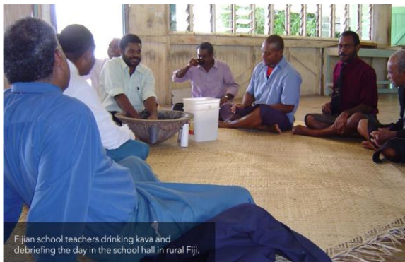
Fijian school teachers drinking kava and debriefing the day in the school hall in rural Fiji.

E laurai talega na veisau ena nodra cakava vakatabakidua e dua na ka ko ira era vakaitavi. Ko ira era sega ni gunu yaqona, era laurai ni tekivu luluqa mai na nodra vakasama na balavu ga ni gauna e sivi e na vakadidike, ka vakatautauvatataki kei ira era gunu yaqona. E laurai ni ra yalo vakacegu ena tekivu ni vakadidike, ia e tubu na nodra vakatabakidua ki na veivakatovolei ni vakadidike ni oti e tolu (3) na aua, ka toro cake sara ni oti e ono (6) na aua. E dina ga ni lailai na macala ni vakadidike, ia e laurai talega ena misini ni mona na kena torocake na vakatagedegede ni kena golevi vatabakidua na vakasama e na gauna e gunuvi kina na yaqona.