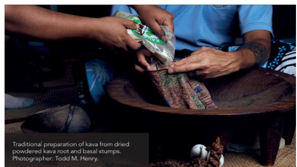
Traditional preparation of kava from dried powdered kava root and basal stumps.

Na nona vakadidike butakatakata ena gauna saraga oqo, ko Dr Apo Aporosa e sauma saraga na vei lomatarotaro eso. Oqo e ka bibi me vaka ni sa tubu cake sara jiko na wiliwili ni tamata era vakayagataka na yaqona ena kena gunuvi vakavanua mai vei ira na kai Pasivika era tiko ena taudaku ni Pasivika. Ka bau talega kina o ira era sega ni oka me vola kawabula ena Pasivika. Vakatabakidua na nona cakacaka taka na revurevu ni yaqona ena kena gunuvi vakalevu ena kena ivakarau vakapasivika kina tuvaki ni vakasama vata kei na mona kei na kena gacagaca ni veiqaravi me vaka na nave kei na uwa. E laurai eke na kena revurevu ena nona bula o koya e vakau lori tiko. Na nona vakadidike e vakayagataki kina na misini ni mona ka buli mai Iurope. Ia e vakayagataka o koya ena dua na ivakavakayagataki ka vakatara tiko na duidui me tiko ena kai iurope se valagi vata kei ira na kai Pasivika. E oka eke na nodra rai, vakarau ni vakasama, itovo kei na vuqa tale na ka.